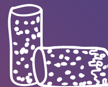
Talls de suro