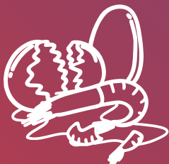
Closques d'ou i marisc