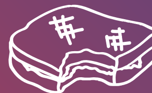
Restes de pa/ menjar en mal estat