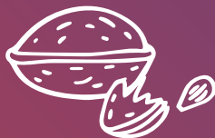
Pells de fruits secs