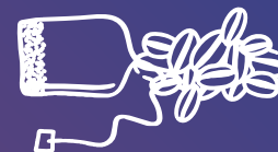
Restes de cafè i infusions