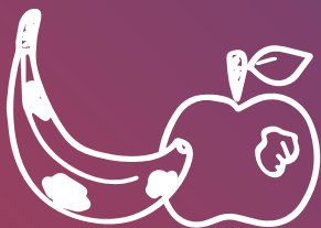
Restes de fruita i verdura