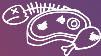
Restes de carn i peix