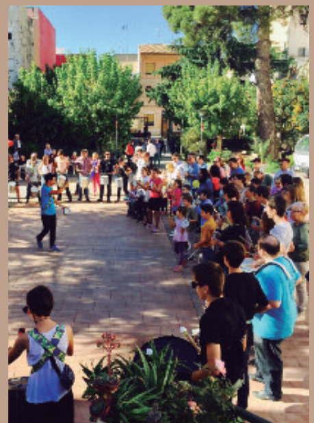
Taller de música en familia durante la I edición.

Una macrobatucada ofrecida por todos los participantes pondrá fin a las actividades, entre las cuales también se encuentra una Jam musical.