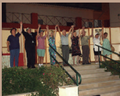
Actuación del Grupo de Teatro "Lo Nostre".