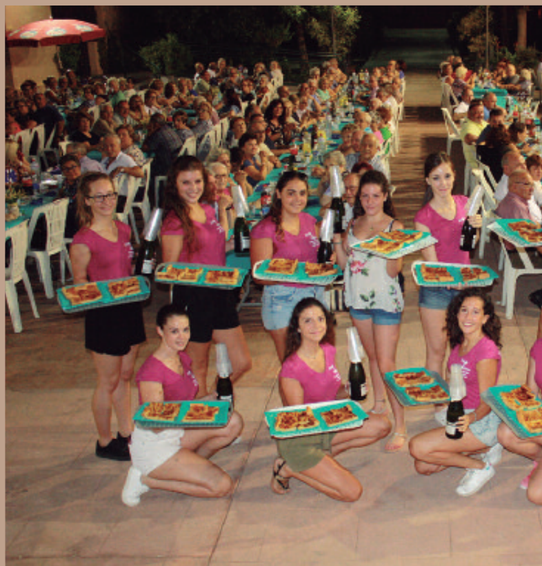
Cena de los mayores, organizada por el Ayuntamiento con la colaboración de las Hijas de María y

Y, por supuesto, agradecemos la entrega y predisposición para pasarlo bien. Las fiestas son para vosotros y sólo son posibles con vuestra participación.