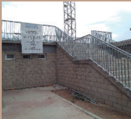
Nuevo acceso a las gradas del campo de fútbol.