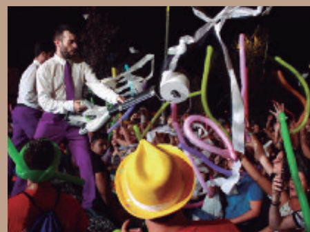
Espectáculo "Tallarina On Tour".