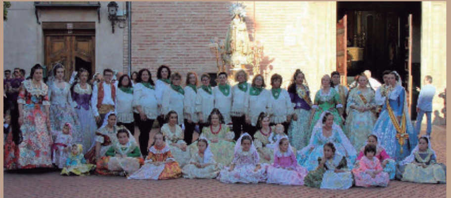
Ofrenda a la Virgen de los Desamparados en la plaza del Ayuntamiento.