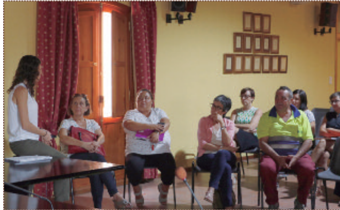
Curso de sensibilización sobre la igualdad de oportunidades, el pasado 12 de septiembre.

En concreto, se trata de cuatro talleres desarrollados por la empresa encargada de poner en funcionamiento el plan, Equaliyu Momentum. El proyecto contempla un curso de sensibilización sobre temas de igualdad de género para toda la plantilla,