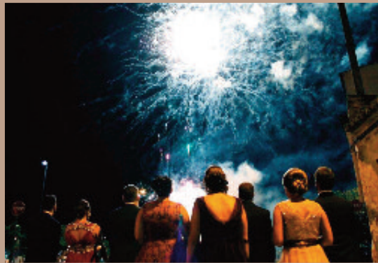
Un grupo de clavarios en un castillo de fuegos artificiales.