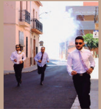
"Traca correguda" de la fiesta del Roser.