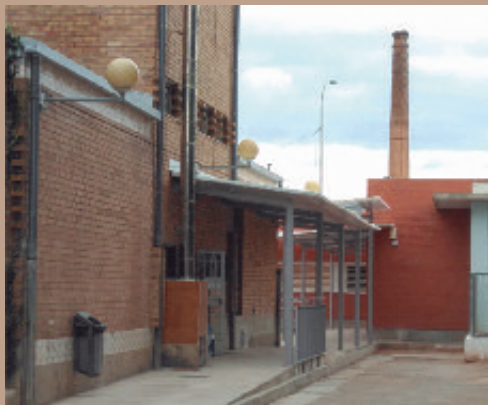
Pasillo cubierto que conecta el colegio con el comedor.

En esa ocasión se actuó sobre dos tramos muy degradados. En concreto, el ubicado en la calle Doctor Navarro, entre San Bertolomé y la calle Mayor, y el otro situado en el callejón de San Vicente, delimitado entre las calles Mayor y Cavallers. También se han hecho obras de mejora en el triángulo formado por las calles San Vicente, Don Emilio Ramón Llin y Cavallers, que se encontraban en mal estado por las obras de mejora de la red del alcantarillado que tuvieron lugar en 2016.