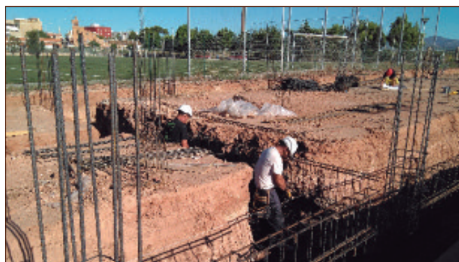
Forjado para la correcta cimentación del futuro trinquete de Alfara.

Además, el Ayuntamiento ha solicitado otra subvención a la Diputación de Valencia para mejorar las instalaciones deportivas. Con ella se podría ejecutar la segunda y última fase del proyecto, que contempla el