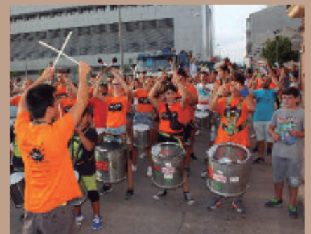
Una batucada abrió este año la cabalgata.