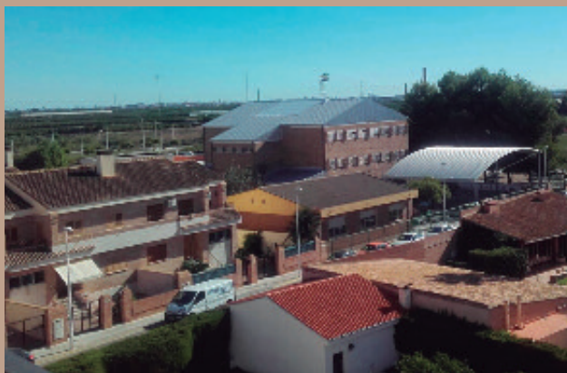
El colegio público, al fondo de la imagen, con el nuevo tejado.

Con la realización de estas obras el Ayuntamiento podrá tramitar la licencia de actividad del recinto deportivo, dado que ya se cumplen las recomendaciones en materia de prevención de riesgos laborales y seguridad. La intervención ha sido sufragada a través del Plan de Inversiones Financiera-mente Sostenibles de la Diputación de Valencia, con una dotación económica de 64.000 euros.