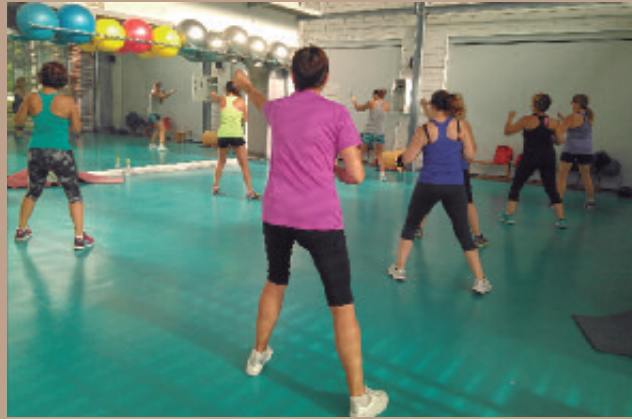
Actividad dirigida por monitora especializada en el gimnasio municipal.

Si lo que quieres es probar y ver si te gusta, el precio mensual es de 2'5 euros.