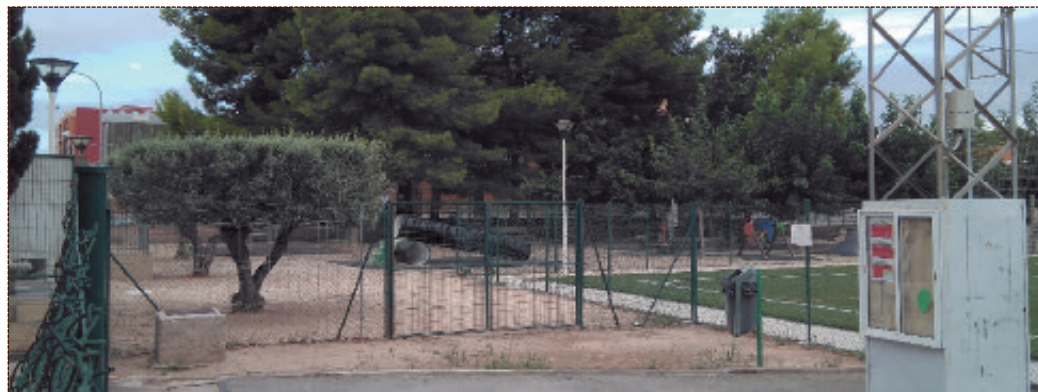
El Ayuntamiento construirá nuevos lavabos públicos en el espacio ubicado entre el parque del polideportivo y el campo de fútbol.

La segunda actuación programada contempla dotar al polideportivo de servicios públicos. Se ha propuesto la construcción de una nueva infraestructura con lavabos en el espacio que hay