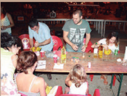
Concurso de alloli de la Peña la Barrancà.