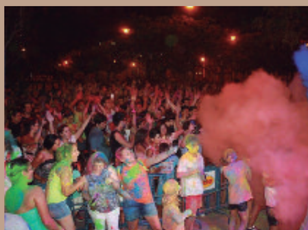
Holy Party a cargo de los clavarios de San Juan de Ribera.