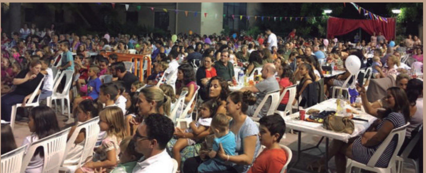
Multitudinaria cena y espectáculo de Circo en los Jardines Municipales, organizado por los clavarios y clavarías de San Juan de Ribera.