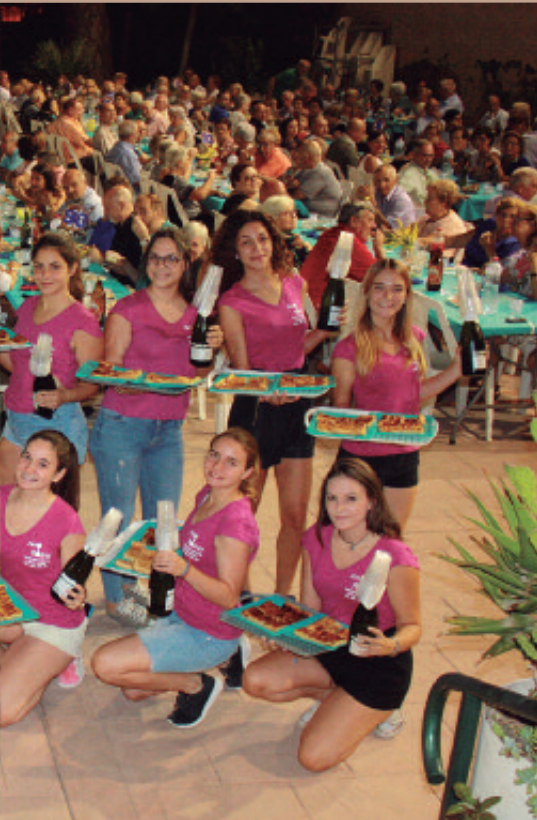
Otras personas voluntarias.