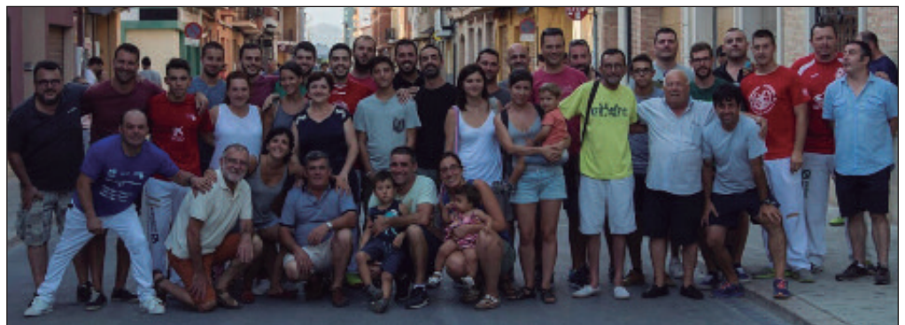
La afición de Alfara junto al equipo ganador del 53 Trofeo de Llargues.

Borbotó contra los equipos de Valencia y Pelayo respectivamente. La gran final tuvo lugar el día 20. Los locales se impusieron por 50 a 30 contra los visitantes.