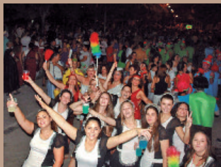
Final de las fiestas con la fiesta de disfraces.