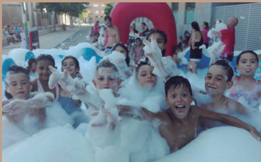
Parque infantil acuático en la zona del CEU organizado por los festeros y festeras de San Vicente.