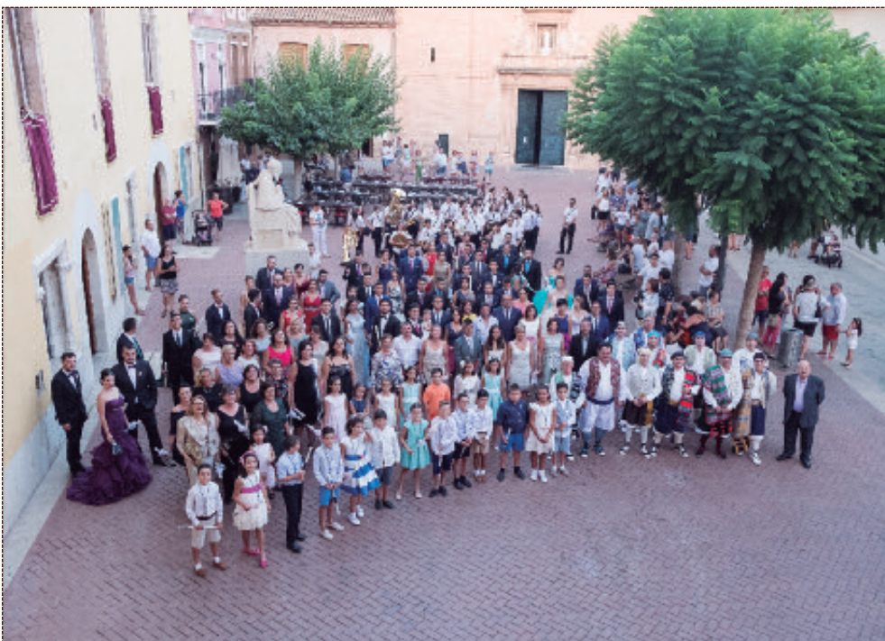
Foto colectiva de todas las fiestas y asociaciones implicadas en la organización de las Fiestas de Agosto.

▶ P.2 80.650 EUROS DEL SUPERÁVIT DE LA DIPUTACIÓ PARA INVERSIONES FINANCIERAMENTE SOSTENIBLES