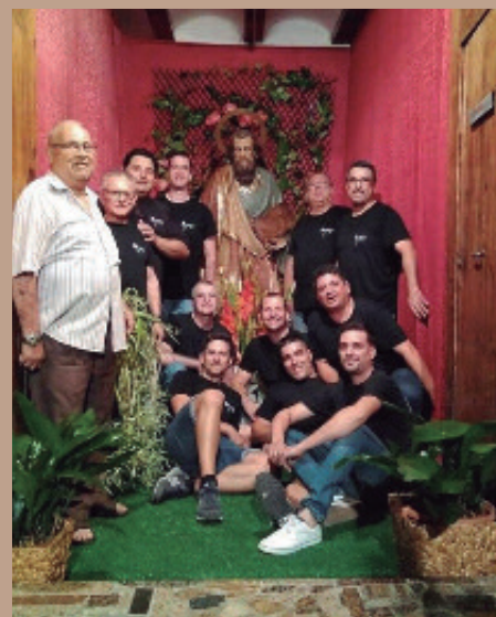
Clavarios de San Bartolomé.