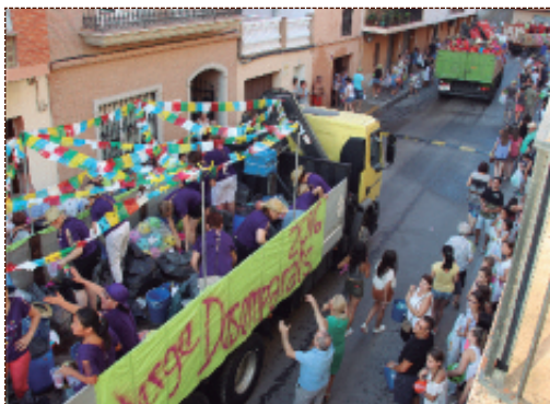
P.7 Lanzamiento de juguetes y caramelos en la cabalgata de Alfara.

Muy buen ambiente y gran participación en la celebración de las Fiestas del pueblo