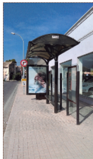
Parada de la EMT de Alfara-Moncada.

Autoridad Metropolitana, desde donde se vertebrará la movilidad y otros aspectos de interés comunitario de toda el área metropolitana de Valencia. Con la puesta en funcionamiento de esa entidad, Valencia podrá optar al contrato-programa, del cual otras capitales españolas ya disfrutaban, y que podría suponer una transferencia de hasta 40 millones del Gobierno de España.