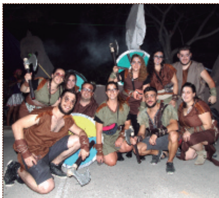
Comparsa ganadora del concurso de disfraces.

Por otro lado, el sábado 8 de octubre habrá pasacalle a cargo de la banda de la Agrupación Musical de Alfara del Patriarca.