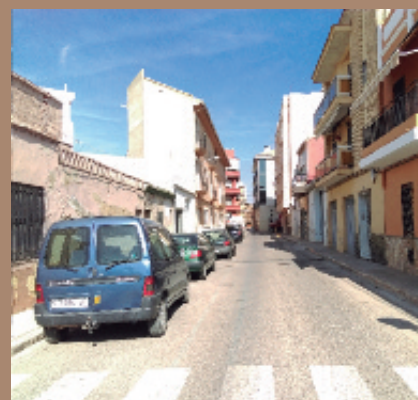
Calle San Vicente.