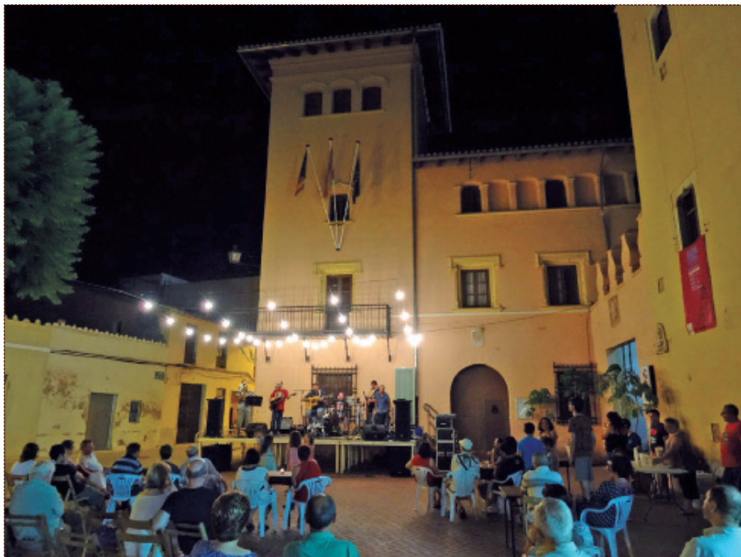
Actuación del grupo de folk Gent del Desert, el 29 de julio en la plaza de la Iglesia dentro del programa “Juliol a la Fresca”.

Los vecinos y vecinas de Al-fara del Patriarca hemos podido disfrutar los viernes del mes de julio de diferentes estilos de música en directo a la plaza de la Iglesia. El programa “Juliol a la Fresca”, desarrollado por las concejalías de Cultura y Juventud, arrancó con la actuación de la Capilla de Ministrers, que estrenó el espectáculo inédito “La Gelosia: Maquiavelismo musical al Quattrocento”. Jesp Quartet Jazz nos ofreció un amplio repertorio musical con la magnífica sensación de cerrar los ojos y dejarse llevar. La formación rockera Aullido Atómico nos presentó su segundo álbum “Todo y ahora” y Gent del Desert cerró la programación musical de julio con música folk fusionada con literatura.