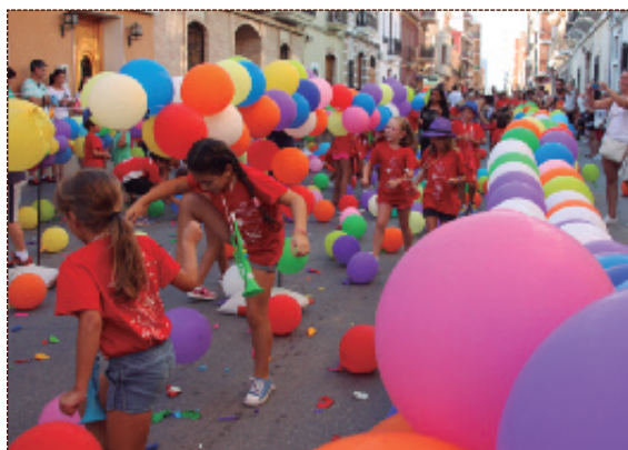
Globotada en la calle Mayores para niños y niñas.