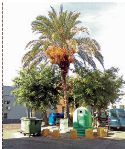
Plaza Nueve de octubre.

vabos y el almacén, donde se construirá un vestuario para el futuro trinquete.