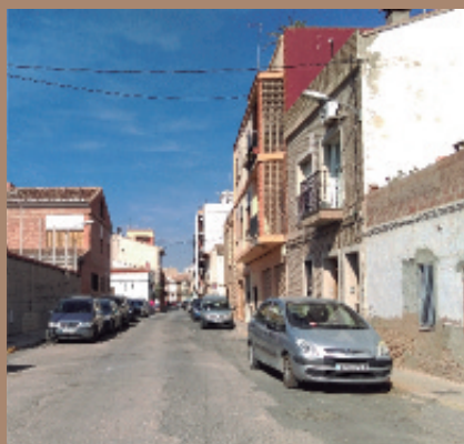
Calle Don Emilio Ramón Llin.