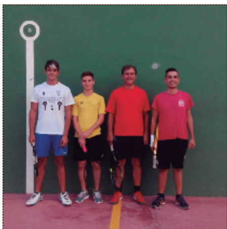
Finalistas del campeonato de frontón.