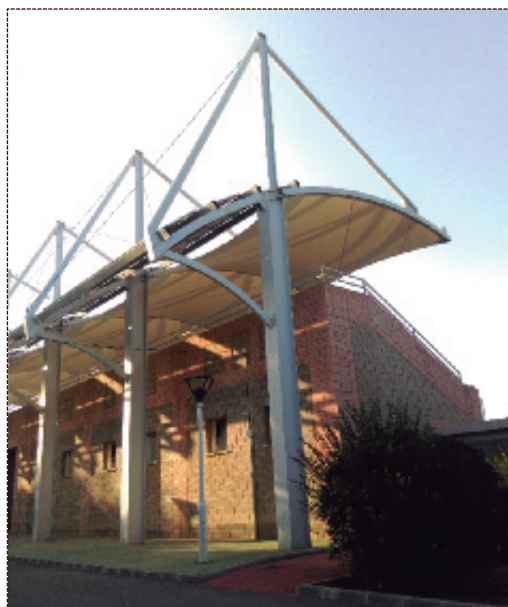
Grada del campo de fútbol del polideportivo municipal.

Una importante parte de esta ayuda se destinará a la construcción de una salida de emergencia a la grada del campo de fútbol. Se instalará una escalera en el otro extremo de la infraestructura con una inversión de 64.000 euros, que también se aprovechará para remodelar los la-