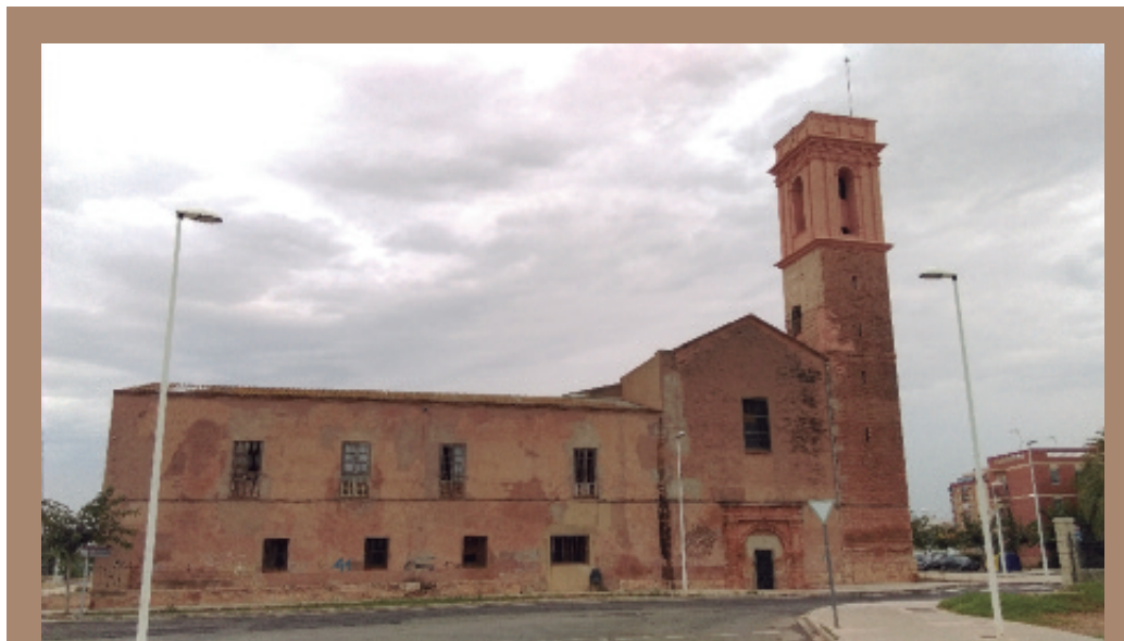
Fachada principal del Convento de San Diego.

En la primera fase de restauración del Convento se tendrá que consolidar el edificio, que data del siglo XVI, respetando la arquitectura de la época y eliminando posibles postizos otros periodos. Las conversaciones iniciales han versado alrededor de un programa plurianual que constaría de varios talleres de ocupación, con lo cual también se favorecería la creación de nuevos puestos de trabajo. Próximamente tendrá lugar otra reunión para seguir concretando la iniciativa.