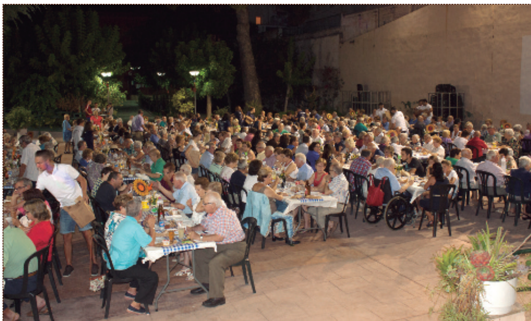
Cena de los Mayores.

Los vecinos y vecinas están tan involucrados que para las Fiestas del 2017 han recuperado las clavarías del Rosario y de San Juan de Ribera.