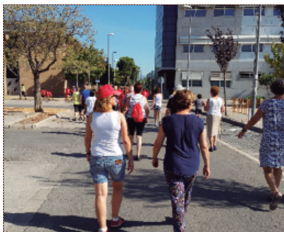
Ruta saludable por las calles de la población.

La semana del 8 al 13 de agosto tuvo lugar la I Fiesta del Deporte de Alfara del Patriarca, con la celebración de competiciones de petanca y de frontón y con la realización de una ruta saludable de 2,5 kilómetros de distancia