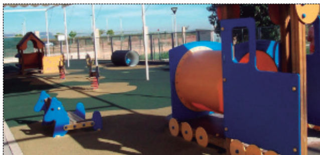
Juegos infantiles en el patio de la Escuela Infantil Municipal de Alfara.

El Ayuntamiento de Alfara ha operado del mismo modo en la confección de la bolsa de trabajo de peón de jardinería, creada recientemente para dar respuesta a la necesidad de mantener en óptimas condiciones los espacios verdes de la localidad.