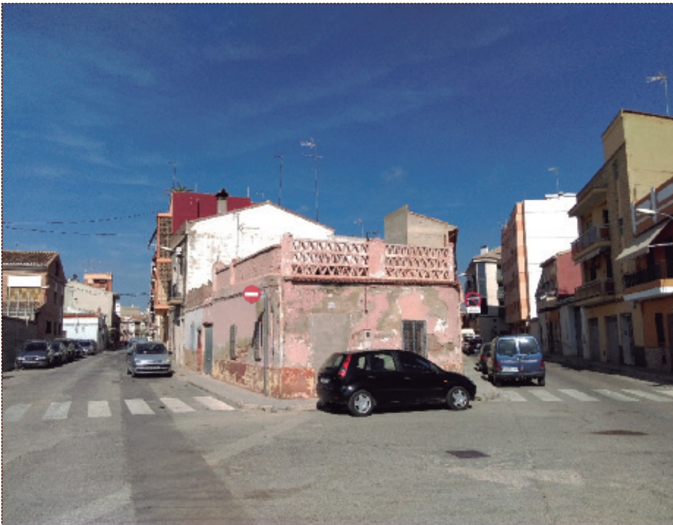
Confluencia de las calles Don Emilio Ramón Llin y San Vicente, que serán asfaltadas con el Plan de Caminos y Viales.

▶ P.3 SE IMPULSA LA RECUPERACIÓN DEL CONVENTO DE SAN DIEGO CON LÍNEAS DE FINANCIACIÓN SUPRAMUNICIPALES