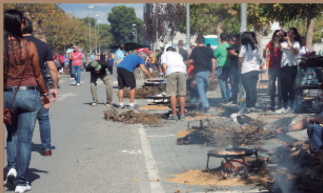
Paellas del 9 de Octubre de 2015, cocinadas en la zona del Ceu.

Para celebrar la Fiesta de la Comunidad Valenciana, el departamento de Cultura ha organizado otras actividades complementarias. El día 6 de octubre se harán las