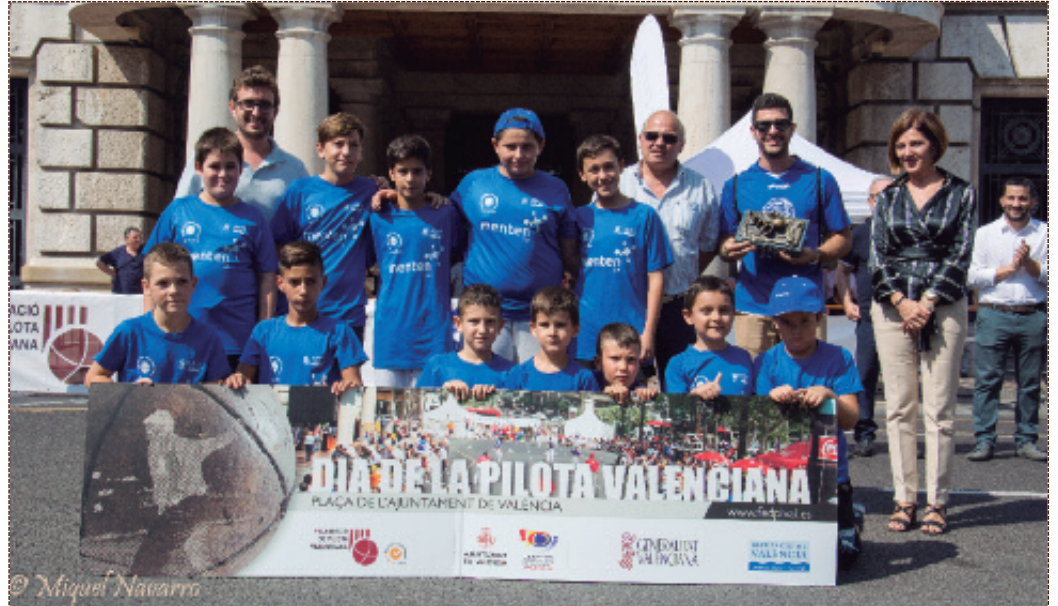
Los alumnos de la escuela municipal de pelota, junto con el alcalde, el técnico y el monitor/.

El galardón fue recogido el pasado domingo 11 de septiembre en la plaza del Ayuntamiento de Valencia, en la entrega de los Premios Anuales de la Federación, en el marco de la celebración de la XXV edición del Día de la Pelota. La jornada festiva por excelencia de nuestro deporte autóctono arrancó a las 9.30 horas con la disputa de partidas de exhibición femeninas, de las escuelas de pelota, de las fallas y de raspall adaptado. A partir de las 10 se entregaron los trofeos de los XXXIV Juegos Deportivos de la Comunidad de Pelota con la presencia de todas las escuelas participantes.