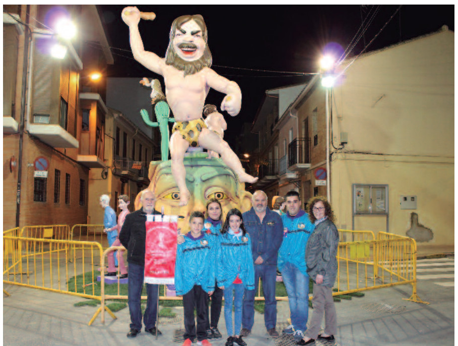
Miembros de la Corporación con las falleras mayores y presidentes de la falla La Unió de Alfara del Patriarca.

Representantes de la Corporación Municipal entregaron el 16 de marzo el banderín conmemorativo que otorga la Generalitat a las localidades para reconocer la tarea que las comisiones realizan en el entramado social valenciano. Con la cremà de los monumentos infantil y grande la Falla La Unió puso punto final a las Fallas 2018.