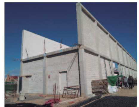
Avanza la construcción del Trinquet Municipal.

Hay previstas otras inversiones durante el 2018, procedentes de fondos propios, para mejorar los equipamientos de la población. Una de ellas es la instalación de una estructura de hierro en la zona dels Rajolars donde poder co-