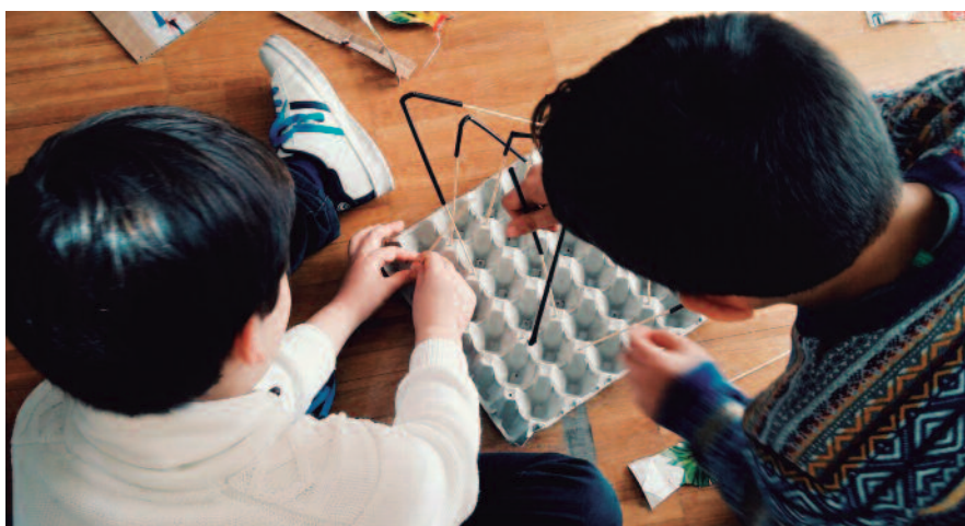
Algunos de los trabajos realizados por los niños y niñas.

El taller de arquitectura infantil empezó el 3 de marzo con una clase demostración gratuita para dar a conocer esta iniciativa. La actividad, dirigida a personas de entre 6 y 12 años, se realiza todos los sábados hasta el 21 de abril. Los jóvenes participantes mejoran su creatividad y visión espacial con la construcción de maquetas arquitectónicas elaboradas con diferentes materiales.