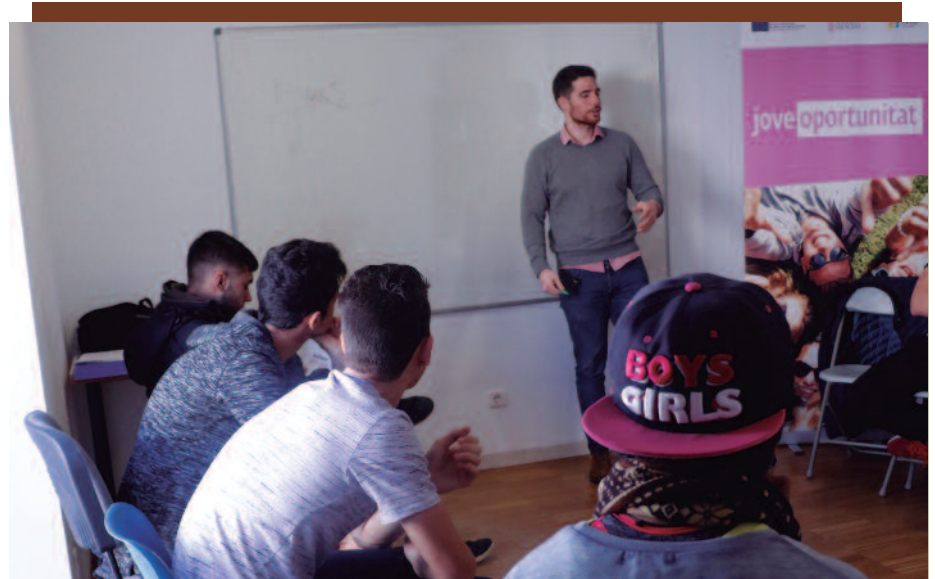
Los jóvenes del proyecto Jove Oportunitat reciben asesoramiento para mejorar las perspectivas laborales.

sitas a varias empresas de distintos sectores para que los jóvenes adquieran una perspectiva más amplia de los trabajos y posibilidades laborales disponibles en la actualidad.