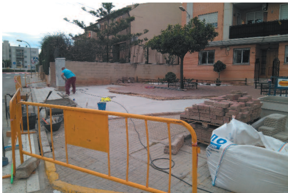
Un operario nivela la superficie de la plaza, sobre la cual se colocarán nuevas baldosas.

Esta actuación ha supuesto la retirada de los árboles del espacio porque, con el paso de los años, las raíces se habían extendido por el subsuelo y levantado el pavimento, hecho que suponía un peligro peatonal. Además, la agravación de este problema habría podido ocasionar daños importantes en las estructuras de los edificios construidos alrededor de la plaza. Con la retirada de la vegetación, la superficie de la plaza y de la acera aumentará considerablemente.