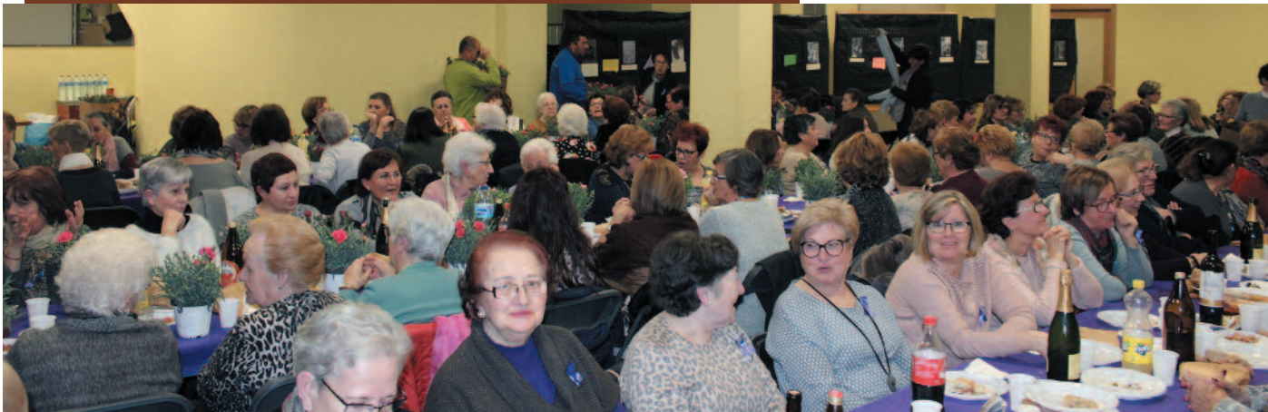
Merienda para mujeres en el Centro Cívico organizada por las Amas de Casa.