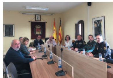
Celebración de la Junta Local de Seguridad.

La reunión, celebrada el pasado 13 de marzo en el salón de plenos del Ayuntamiento, también sirvió para coordinar las acciones de prevención en seguridad para la Trobada d'Escoles en Valencià, que acogerá nuestro pueblo el próximo 22 de abril y para la que se espera a más de 10.000 asistentes.