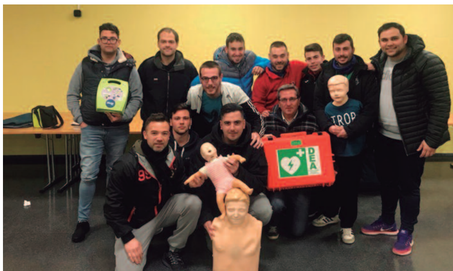
Reunión informativa del pasado 25 de enero sobre la concienciación y prevención de la muerte repentina.

Esta formación se enmarca dentro del proyecto "Alfara: espacio cardio-protégido", a través del que se adquirieron el año pasado dos desfibriladores semiautomáticos. Uno de ellos está ubicado permanentemente en el vehículo policial y el otro, en las instalaciones deportivas. Además de este curso, se programó otro para los agentes de la Policía Local.