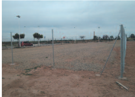
Ya está instalada la valla que delimita el parque canino.

Los trabajos de adecuación finalizarán dentro de pocas semanas, lo que permitirá la realización en el es-