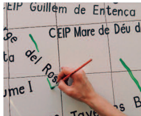
Alfara recibirá un recuerdo por organizar las Trobades 2018.