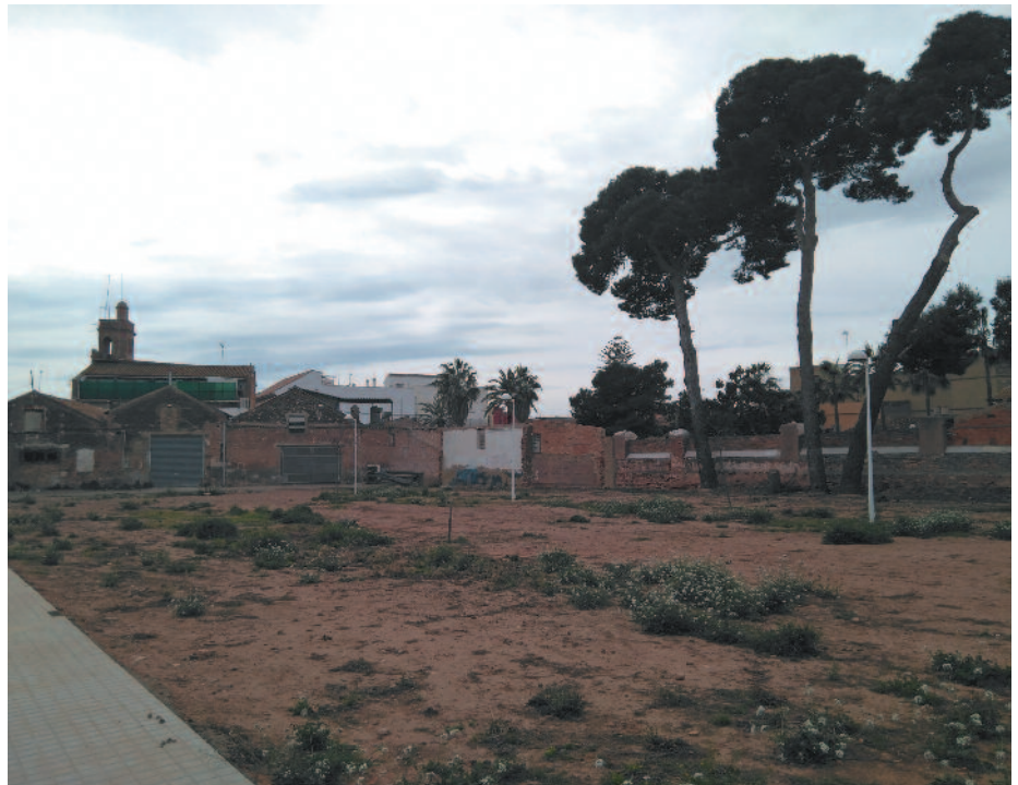
Solar municipal ubicado junto al Calvario donde está prevista la construcción de un espacio con paellers.

Las instalaciones contarán con 10 paellers, dos zonas donde poder lavar las cazuelas, baños públicos y mesas de tipo pícnic donde poder comer y hacer la sobremesa. Además, se reservará un rincón específico para la elaboración de calderas, de forma que los diferentes colectivos del pueblo que organizan periódicamente este tipo de comida popular tengan un lugar adecuado y definitivo donde poder cocinar y ofrecer las raciones al vecindario.