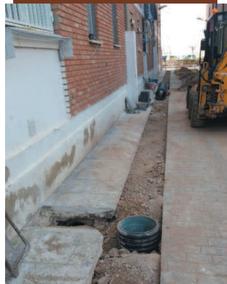
Obras en las canalizaciones de los Grupos de la Paz.

Hace poco más de dos años, Aigües de València ya llevó a cabo algunas mejoras en la red de saneamiento en el tramo de la calle Don Emilio Ramón Llin comprendido entre la calle Cavallers y el Calvario. Los trabajos consistieron en la instalación de nuevas cañerías subterráneas y la construcción alcantarillas con el objetivo de favorecer la correcta evacuación del alcantarillado.