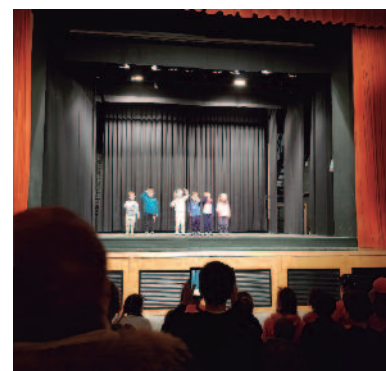
Actuación de la escuela de educación física de base.

Algunos de estos profesionales participarán en el Campus de Pilota que organizan el Ayuntamiento y el Club entre los días 3 y 6 de abril en el polideportivo. Los vecinos y vecinas del pueblo, por un precio de 20 euros, podrán ver una partida de pelota valenciana y disfrutar del deporte autóctono durante las vacaciones de Pascua con actividades adaptadas a cada edad y nivel de los jugadores.